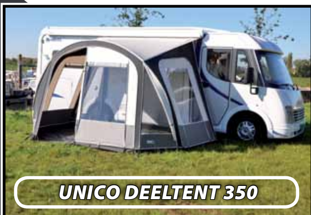
UNICO DEELTENT 350