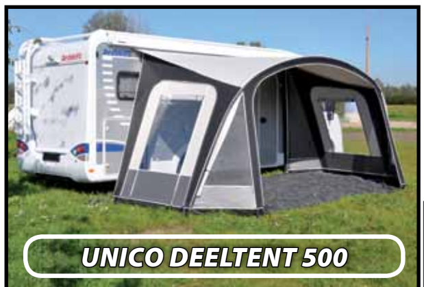
UNICO DEELTENT 500