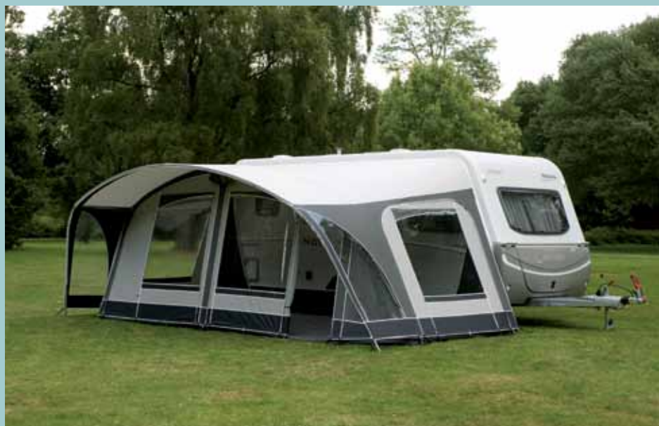
Unico voortent Genua 280 antraciet/grijs

CONCLUSIE De Unico Genua is door zijn constructie en het sterke All Season-doek een van de meest stormvaste voortenten die er zijn. Opvallend is de zeer ruime petlufel die een meter uitsteekt, waardoor de twee folieramen droog en schoon blijven. Verder valt de zorgvuldige afwerking op en het gebruik van topmaterialen.