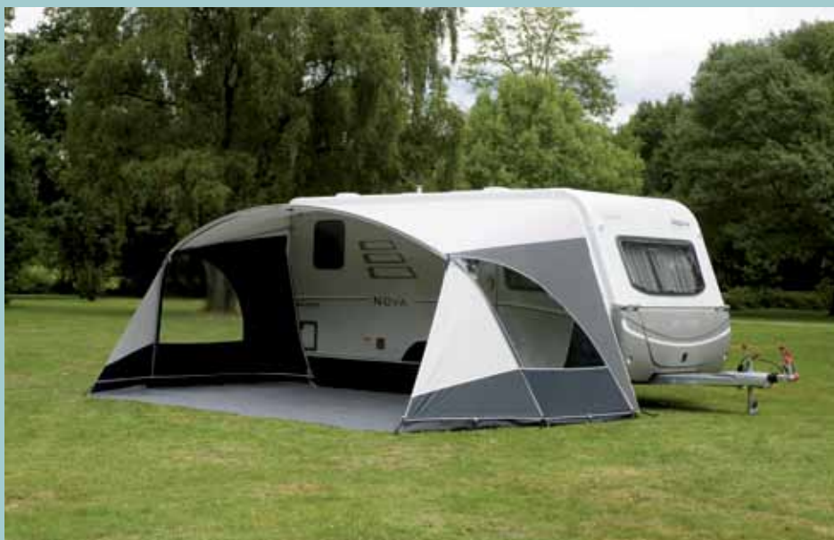
Unico Verona luifel antraciet/grijs

Met de mogelijkheid om er een voorwand in te ritsen, valt de prijs opeens reuze mee. En af spannen, dat doe je met afspanbanden i.p.v. tentelastieken.