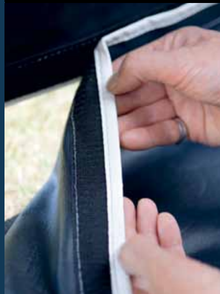
Superhandig! Afneembare slikranden