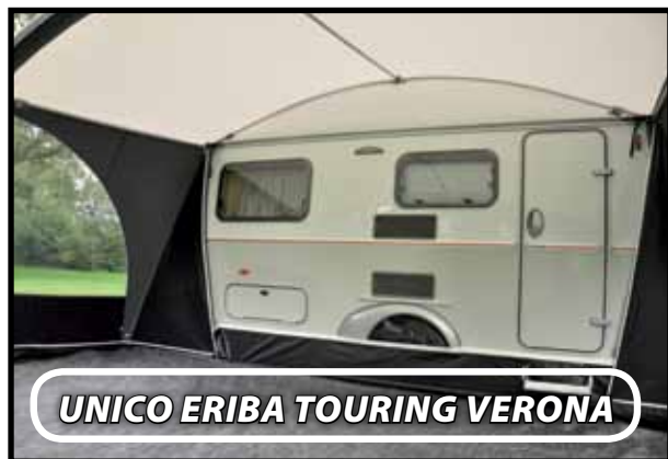
UNICO ERIBA TOURING VERONA