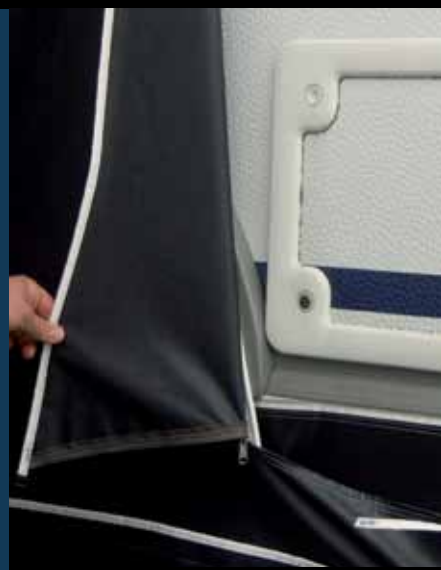
Voorzien van rits t.b.v. serviceluijk