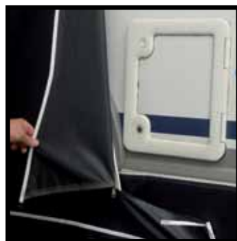
De Unico Bologna, Genua en Verona, zijn voorzien van rits t.b.v. serviceluis.