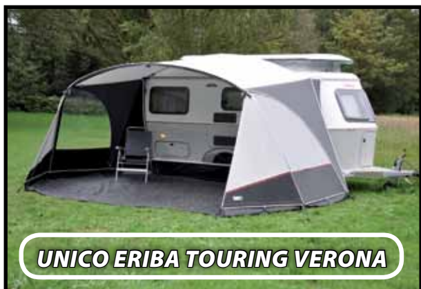
UNICO ERIBA TOURING VERONA