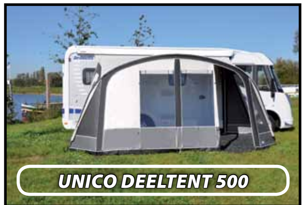
UNICO DEELTENT 500