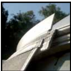
Eriba strip voor betere waterafvoer