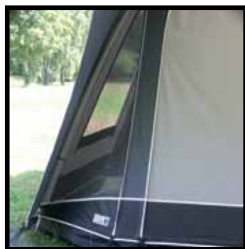
Ventilatie panelen in Unico voortenten. Deze zijn afsluitbaar d.m.v. klep met rits.