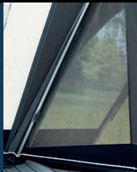
Afsluitbare ventilatiepanelen in voorwand