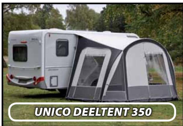
UNICO DEELTENT 350

De Unico Deeltent 350 is zowel te gebruiken aan caravan, camper als kampeerauto. Dit is de snelst opzetbare kwaliteits-deeltent op de markt, het frame bestaat uit één in hoogte verstelbare boogstok en heeft een drietal aluminium dakliggers.