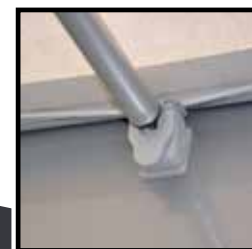
Quick Lock steun