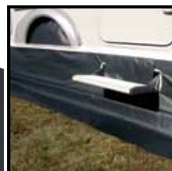
Tochtstrook + wiel flap